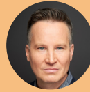
Moderation & Keynote „No Spoilers! 7 Wetten auf die Zukunft (... und warum es wahrscheinlich ganz anders kommt!)“ Richard Gutjahr